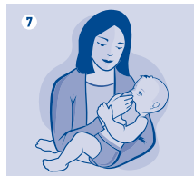
Adults & Children / Erwachsene & Kinder / Erişkinler & Çocuklar